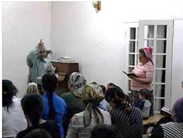
Dove broeder gaat voor in gebarentaal in de baptistengemeente van Qarshi.

Leven als Dove Christen in Oezbekistan. Vaak met gevaar voor eigen leven.